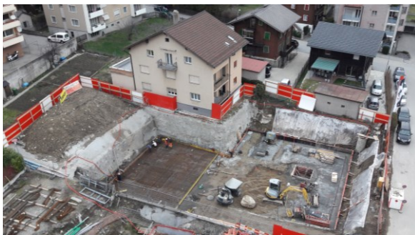
Baugrubensicherung und Bodenplatte 1. Etappe