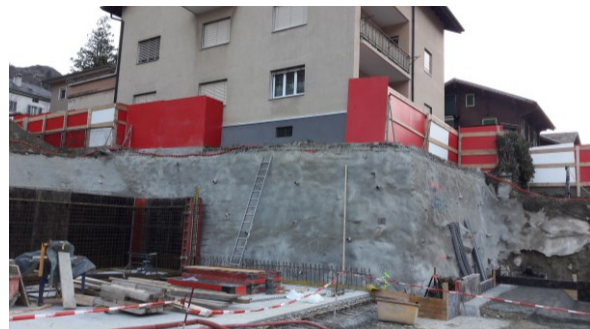
Wände UG 1. Etappe und Baugrubensicherung