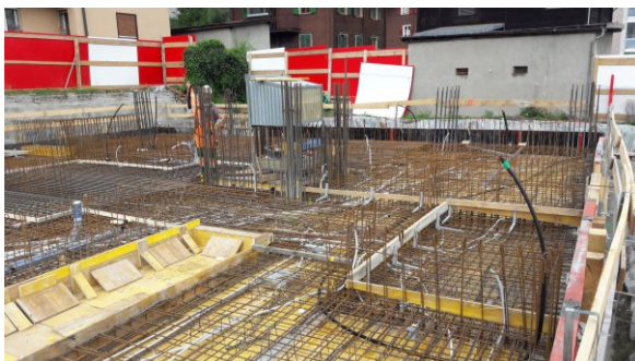
Decke UG Teil Haus